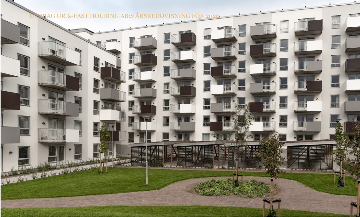
Kvarteret Brigaden i Helsingborg.

entledigas enligt aktiebolagslagen och bolagsordningen innehåller inga särskilda regler för detta.